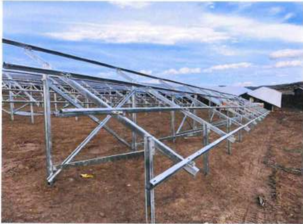
Solar Enerji Sistemleri Konstrüksiyonları Örnek Resim

Yenilebilir enerji sektöründe 2023 yılında yayınlanmış olan Solarpower Europe Küresel Pazar Raporu'na göre ( https://www.solarpowereurope.org/ ) globalde mevcut kurulu güç 1,2 Terawatt olmakta birlikte, 2025 yılı 1. çeyreğinde 2 Terawatt, 2027 yılı sonunda ise 3,5 Terawatt kurulu güç olması öngörülmektedir. 2025 yılı kurulu güç hedefine göre 28.000.000 ton çelik ihtiyacı öngörülmekte olup, 2027 yılı planlamasında ise gerekli olan çelik kullanımı ortalama 80.500.000 ton olarak değerlendirilmektedir. PwC sektör raporuna göre ( https://www.pwc.com.tr/tr/sectorler/enerji/turkiye-ve-dunyada-gunes-enerjisi-sektoru-raporu.pdf ) ise net sıfır karbon temiz enerji hedefine ulaşılması için 2050 yılında toplam kurulu gücün 9 Terawatt üzerine çıkması gerekmektedir. Şirket, yapmış olduğu çalışmalar ile bu pazarda yer alarak pazar payını artırmayı hedeflemektedir.