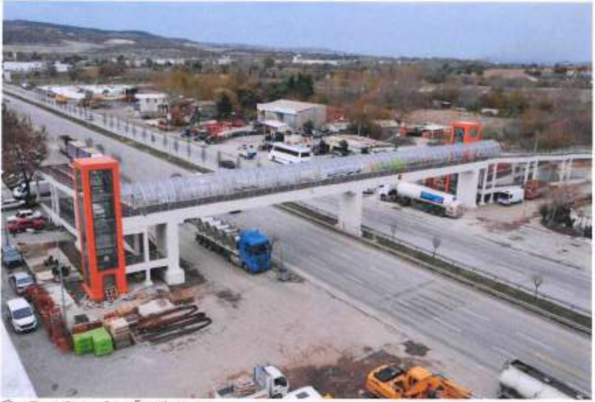
Üst Geçit Sistemleri Örnek Resim