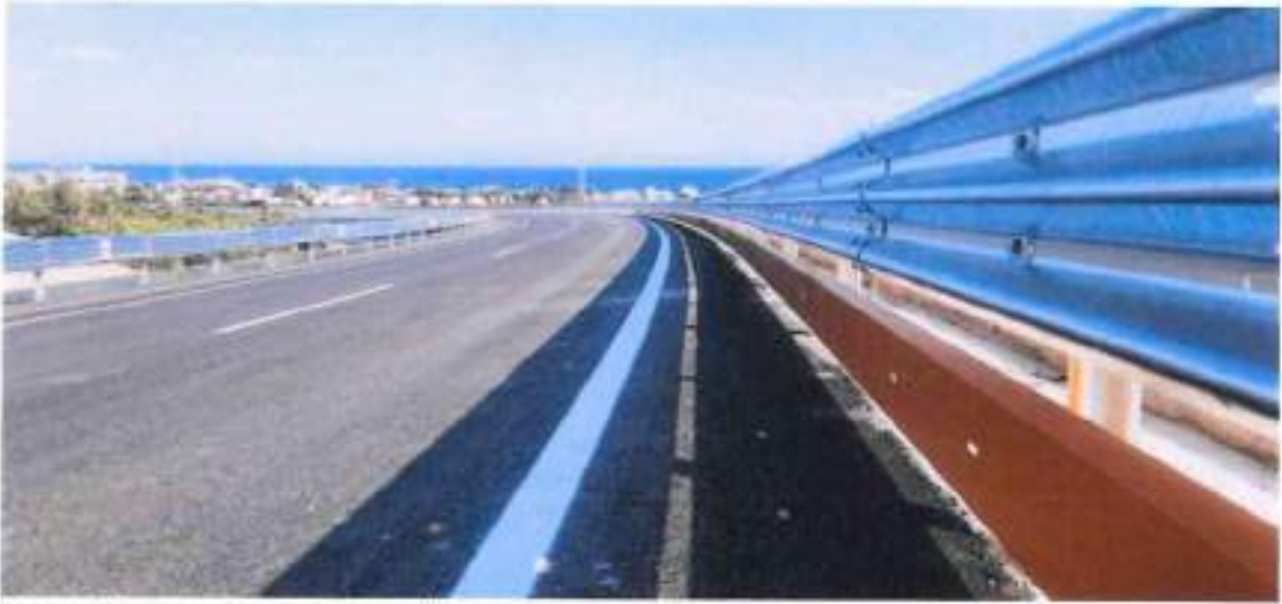
Motosiklet Koruyucu Bariyer Örnek Resim

Motosiklet koruyucu bariyerlerin rayları soğuk şekillendirme sonrası sıcak daldırma galvanizlemeye ve/veya toz boya işlemine tabi tutulur. Şirket, Karayolları Genel Müdürlüğü ve Büyükşehir Belediyeleri ile yaptığı iş birlikleriyle motosikletliler için riskli noktaların belirlendiği ve o noktalara motosiklet koruyucu sistemlerin uygulandığı projeler yürütmüştür. Karayolları Genel Müdürlüğü, motosiklet sürücülerin güvenliğini sağlamak amacıyla 2022 yılında çalışmalarını artırmıştır. Bu kapsamda 2022 yılında Karayolları Genel Müdürlüğü tarafından Türkiye genelindeki devlet ve otoyollarını kapsayan iki ihale açılmıştır. Şirket, açılan bu iki ihaleyi de kazanarak motosiklet koruyucu bariyer üretim ve montaj işlemlerini hızlandırmıştır.